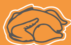
Ongelijk/ Geteelde producten