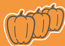
Producten met verschillende geometrieën in flowpacks

Vooraf aanbevolen voor onregelmatige producten, zoals hele kip, groenten in flowpacks, skin-verpakking of stukken kaas.